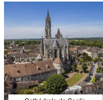
Cathédrale de Senlis

Nota : Pour le tour de Ville de SENLIS prévoyez de bonnes chaussures de marche en raison de ruelles en pavés de grès !...et surveillez la météo avant de choisir vos tenues vestimentaires.