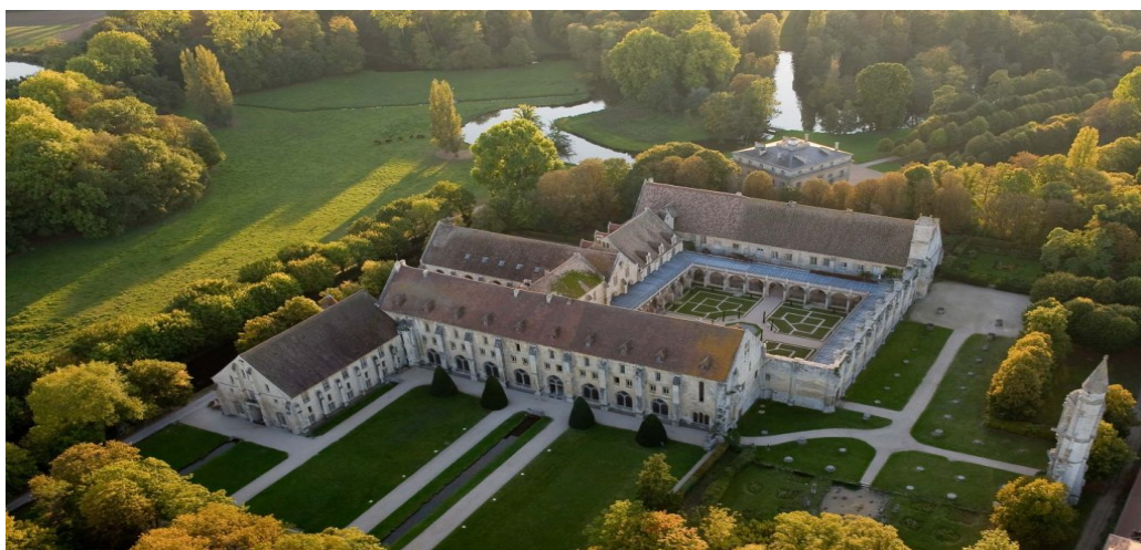
Abbaye Royale de Royaumont

Après un petit CONCERT privé avec l'Organiste de l'ABBAYE...un apéritif vous sera servi dans le jardin et un dîner nous rassemblera dans le réfectoire voûté autour d'un menu de saison avec des produits venant du potager de l'Abbaye.