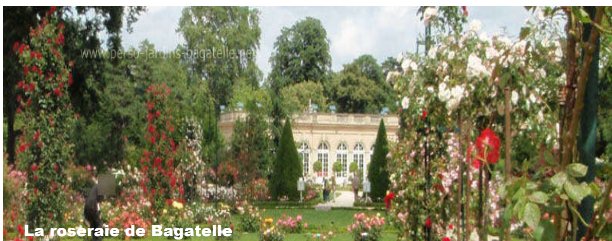
La roseraie de Bagatelle

couler douce à l'heure du déjeuner, ambiance feutrée. De 12h30 à 14h30.