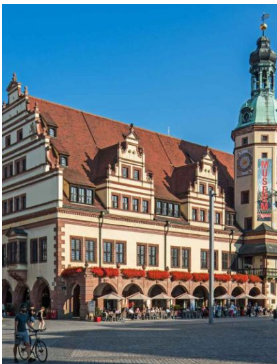
Rathaus - Leipzig

Après-midi : Musée des Beaux-Arts constitué d'une importante collection d'œuvres d'Art de la fin du Moyen Age à l'époque contemporaine. L'accent sera mis sur les peintres germaniques dont : KOCH – KLINGEL – CRANACH l'Ancien – C.D. FRIEDRICH et le suisse GRAFF ;