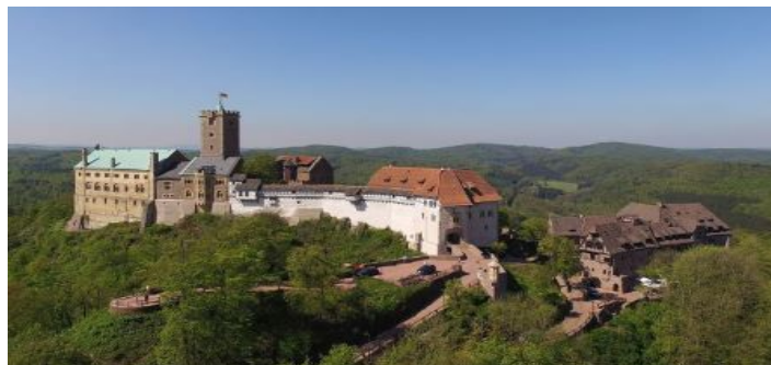
La forteresse de la Wartburg