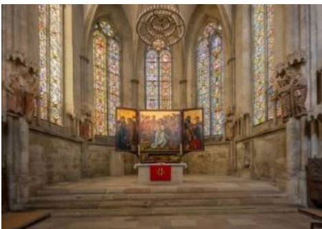
Naumburg – Cathédrale

Diner en route....dans la campagne ... « Gasthof Stiefelburg »... et retour à Weimar.