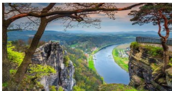
Le Bastei et l'Elbe